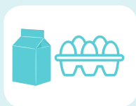
ΓΑΛΑ - ΑΥΓΑ