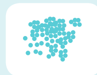
ΣΠΟΡΟΙ & ΠΟΛΥΦΛΑΣΙΑΣΤΙΚΟ ΥΛΙΚΟ