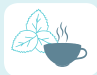
ΦΑΡΜΑΚΕΥΤΙΚΑ ΚΑΙ ΑΡΩΜΑΤΙΚΑ ΦΥΤΑ