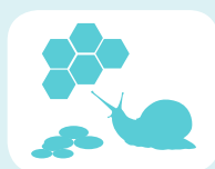
ΜΕΛΙ - ΣΗΡΟΤΡΟΦΙΑ - ΣΑΛΙΓΚΑΡΙΑ